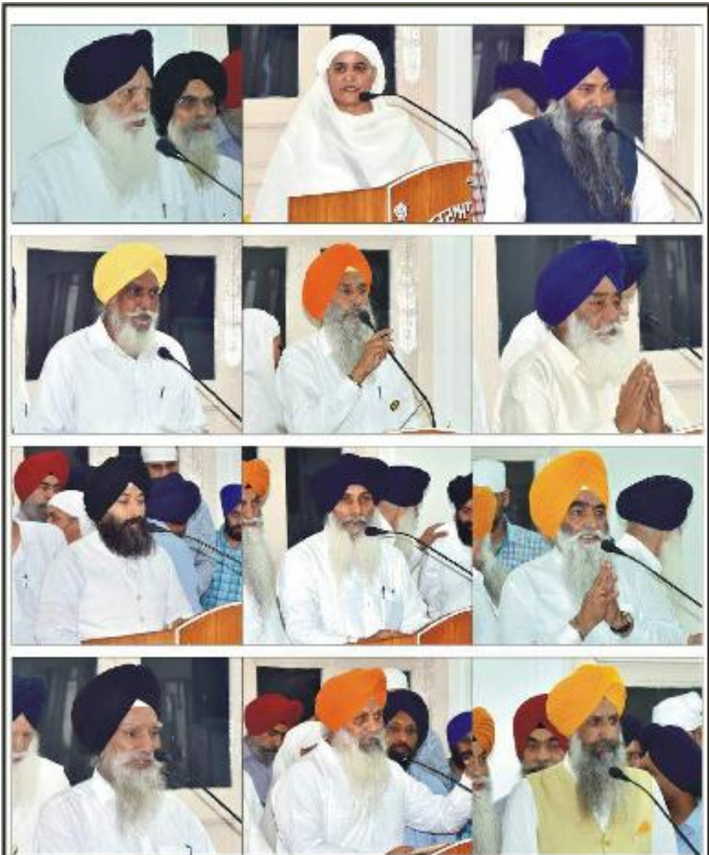
ਸ਼੍ਰੋਮਣੀ ਗੁਰਦੁਆਰਾ ਪ੍ਰਬੰਧਕ ਕਮੇਟੀ ਦੇ ਜਨਰਲ ਇਕਲਾਸ ਦੀ ਕਾਰਵਾਈ ਜਮੈਂ ਵੱਖ-ਵੱਖ ਅਹੁਦੇਦਾਰਾਂ ਦੇ ਨਾਮ ਪੇਸ਼ ਕਰਦੇ ਹੋਏ ਅਤੇ ਡਾਈਦ, ਮਸ਼ੀਦ ਕਰਦੇ ਹੋਏ ਸ਼੍ਰੋਮਣੀ ਕਮੇਟੀ ਦੇ ਮੈਂਬਰ ਸਾਹਿਬਾਨ ।